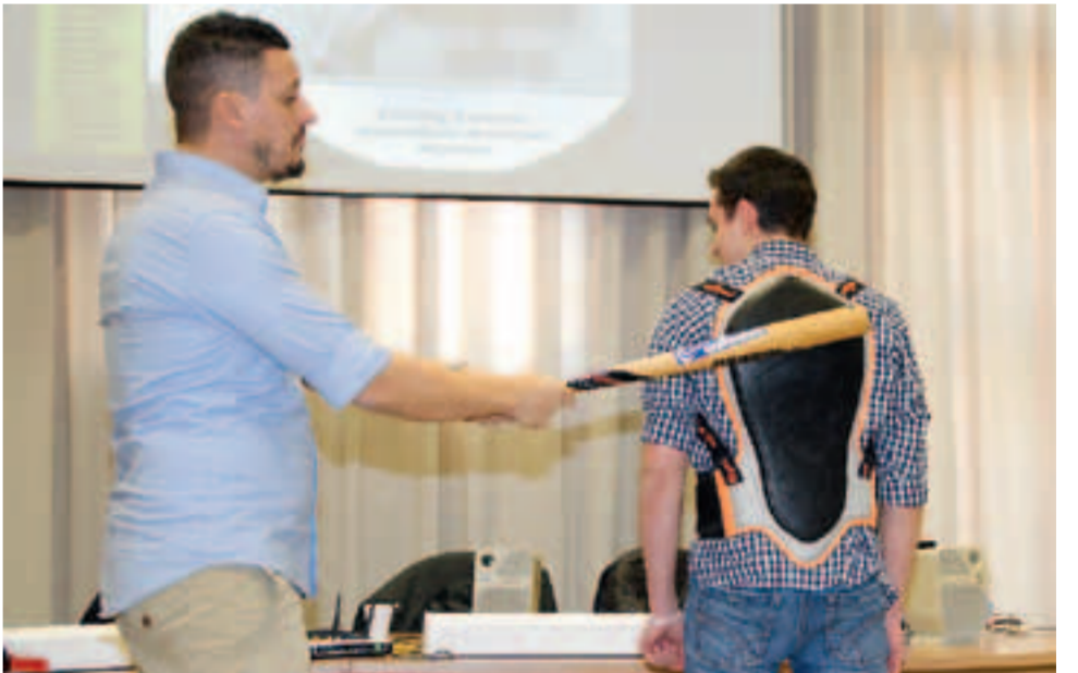
Un parasciema da moto indossato e letteralmente testato da uno studente del Balbo